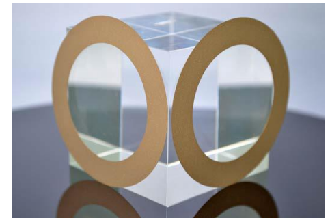
カッティングブレード

各工程で残留した内部応力が、最終工程により十分除去されることが確認され、工程改善、製品の高信頼性化につながった。 今後はひずみ取り工程の最適化を検討する予定。