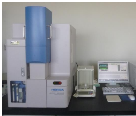
図3 装置外観 (EMIA-920V2、(株)堀場製作所)