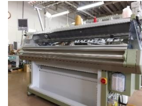
ホールガーメント編み機