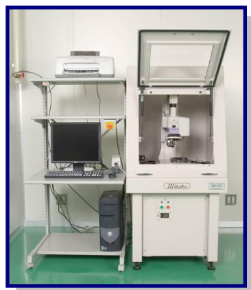
非接触三次元測定器