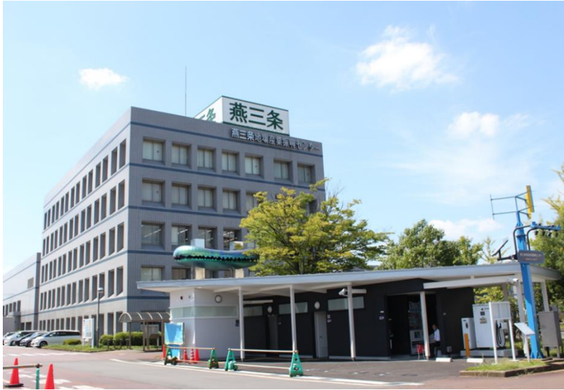
県央技術支援センター (燕三条地場産業振興センター メッセピア3F)