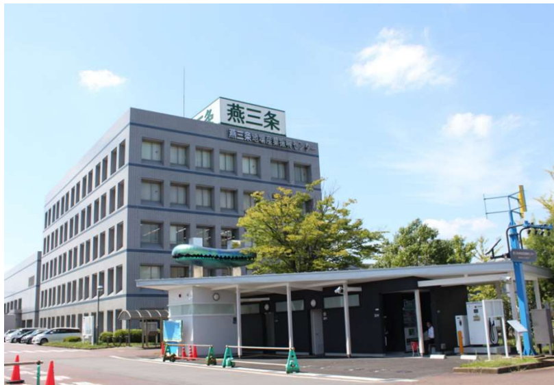
県央技術支援センター (燕三条地場産業振興センター メッセピア3F)