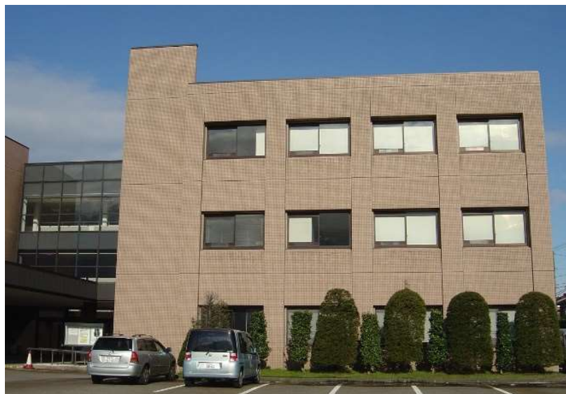
加茂センター (加茂市産業センター2F)