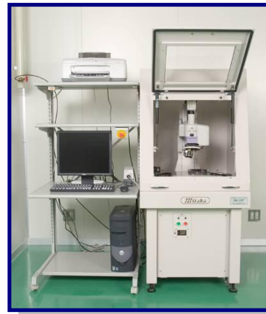
非接触三次元測定器