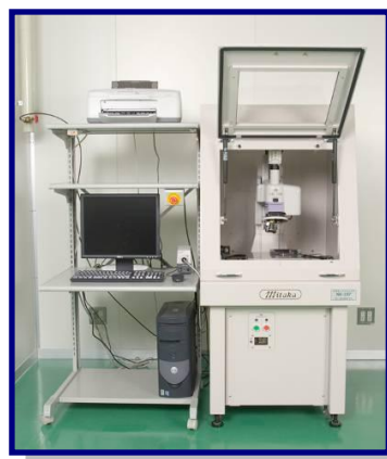
非接触三次元測定器