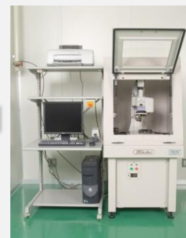
非接触三次元測定装置