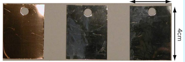
めっきサンプル(テストピース:TP)外観