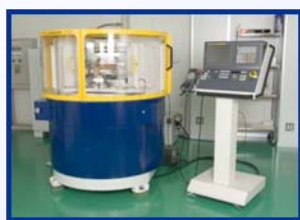
超精密ナノ加工機