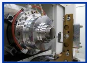
精密レンズ金型の加工例