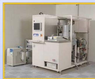
ドライエッチング装置