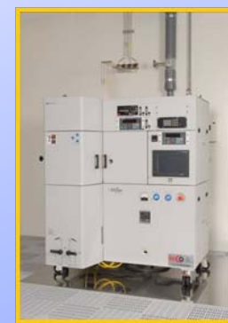
スパッタリング装置