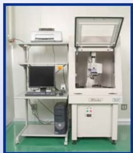
非接触三次元測定装置