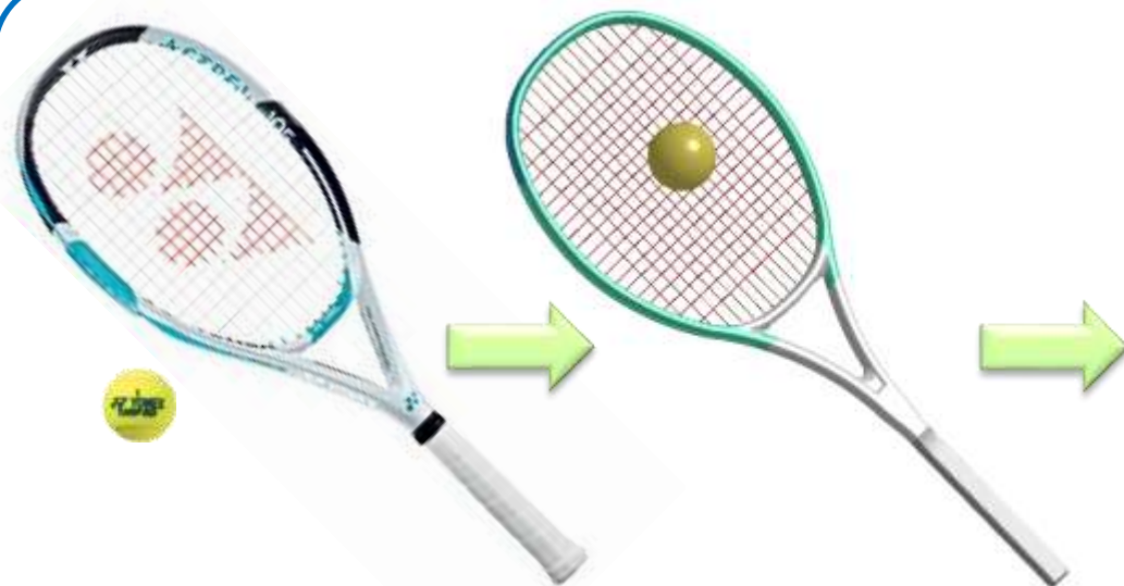
テニスラケットとボールの解析モデル構築