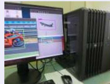
ディープラーニング 用コンピュータ (GPUを4台搭載)