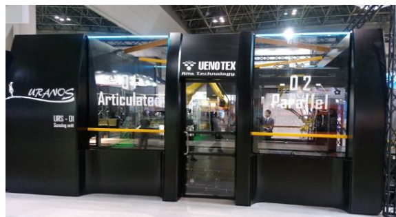
AI搭載 廃棄物自動選別 ロボットの開発支援